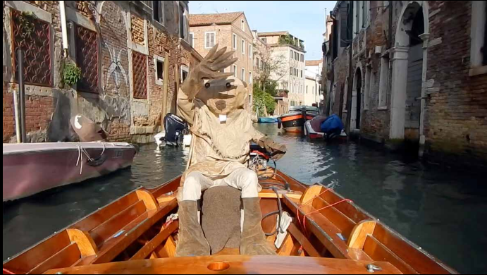
"Castor Magellanica", 2015 Video, 24 min. Videostill