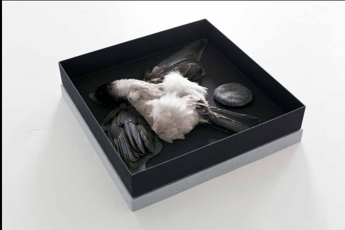
“Trophé Corvus Cornix”, 2015