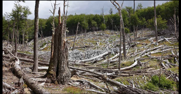
"Vicuña, Valley of the Dammed", 2015 Photo