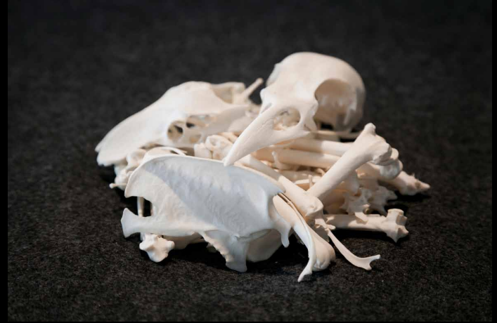
“Momento mori I Corvus Cornix”, 2015. Kråkeskjelett